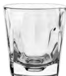
Stephanie (optisch/optical) 5 cl