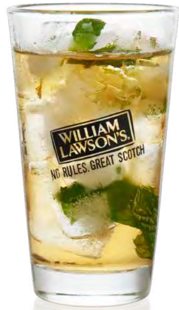
Lawson Longdrink Exclusiv 35 cl