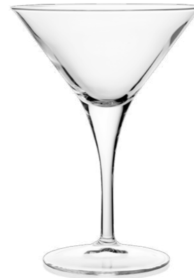
Cocktail Mini 10 cl

Wermut zählt wieder zu den In-Spiritosen jeder Bar – im Glas und auch in den Köpfen der Menschen. Man schätzt die Aperitifweine als entscheidende Zutat in Klassikern wie dem Manhattan oder Martini, als Longdrink mit Soda oder Tonic, oder eben als Solist. Genauso vielfältig: die Glasauswahl von RITZENHOFF, um Ihre Marke perfekt zu präsentieren.