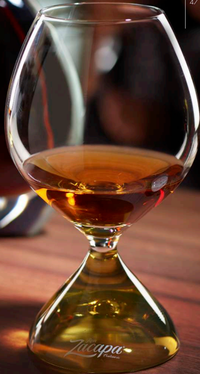
Ron Zacapa Exclusiv 47 cl

The Zacapa XO Ultra-Premium-Rum is a five-time winner of the International Rum Contest and has a place in the 'Rum Hall of Fame'. Perhaps RITZENHOFF's exclusive glasses also made a small contribution to that.