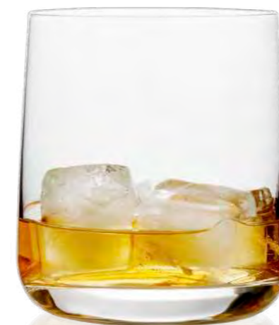
Next Whisky 40 cl