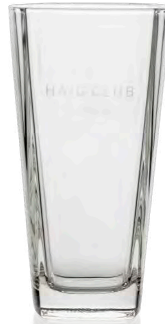
Stephanie 34 cl | 36 cl