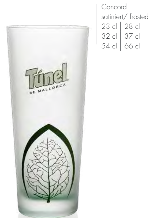
Concord satiniert/ frosted 23 cl | 28 cl 32 cl | 37 cl 54 cl | 66 cl

Whether classic Italian herbal or bitter liqueurs or creamy chocolate liqueurs – they like to be served on ice. Glass and decor solutions, e.g. ‘freezing’ the glass, helps to give your brand a cool appearance.