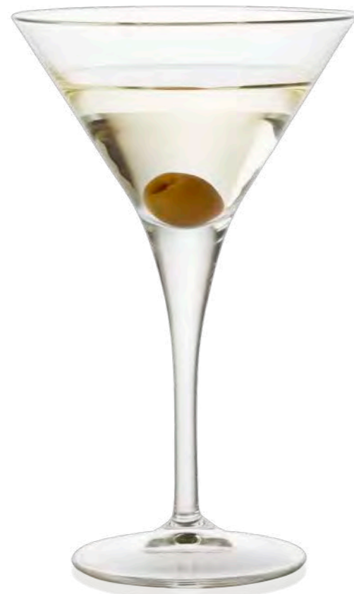
Cocktail Y 24,5 cl