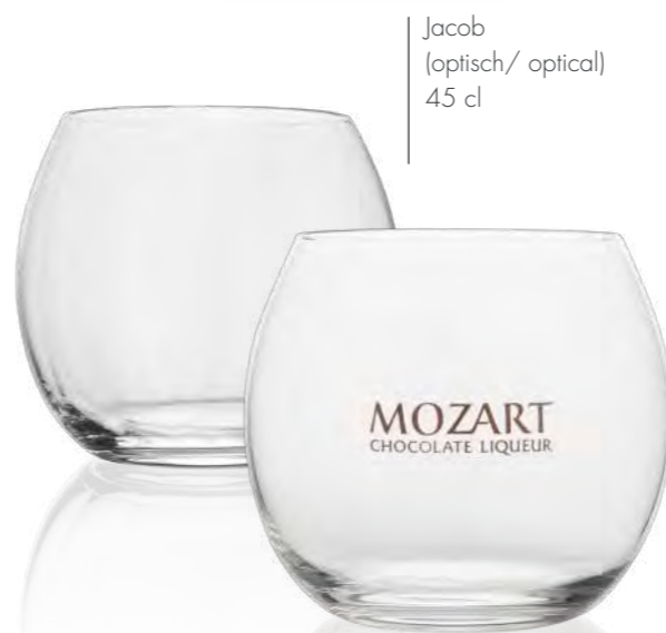
Jacob (optisch/ optical) 45 cl