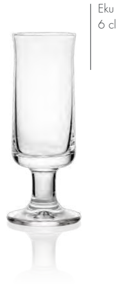
Eku 6 cl