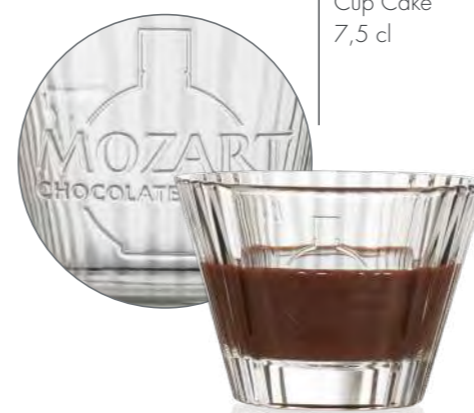
Cup Cake 7,5 cl