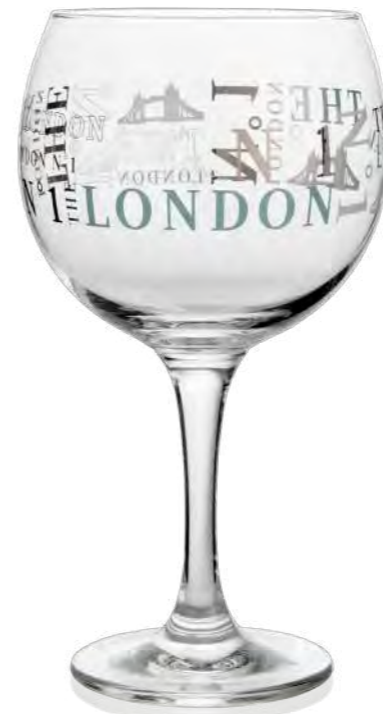
Gin Club 62 62 cl