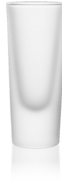
Rocky satiniert/ frosted 15 cl