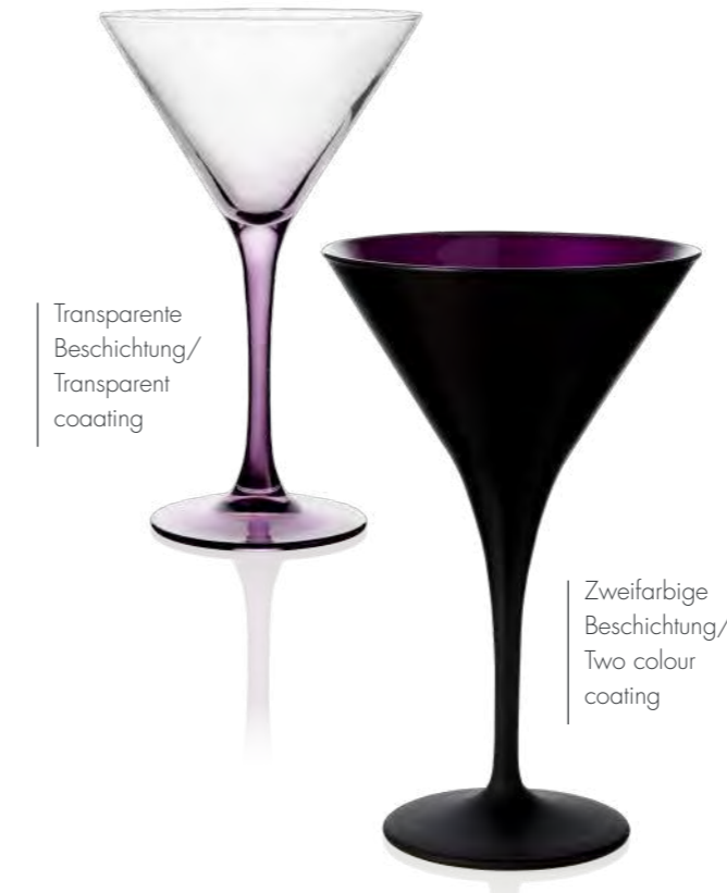
Transparente Beschichtung/ Transparent coating

The range of decorative elements in the area of coatings is almost limitless: partial or complete coatings, coloured, metallic or satin finished, matt or shiny, opaque or semi-transparent. A brand logo can also be added, of course. Ask about the available options!