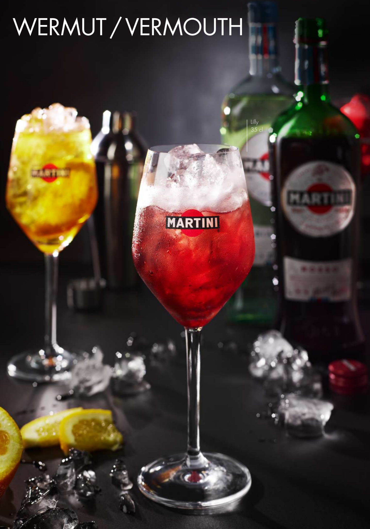
Lilly 35 cl