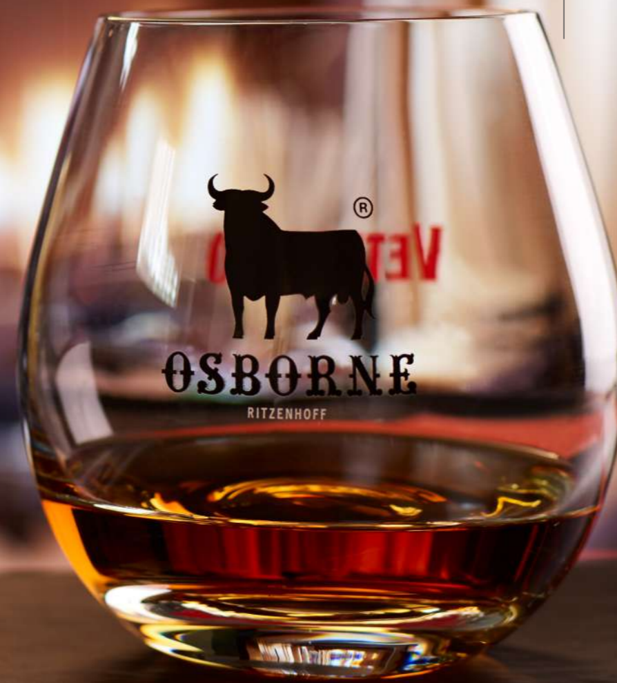
Veterano 30 cl