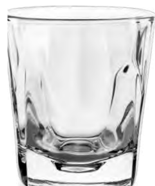
Stephanie Tumbler (optisch/optical) 34,5 cl