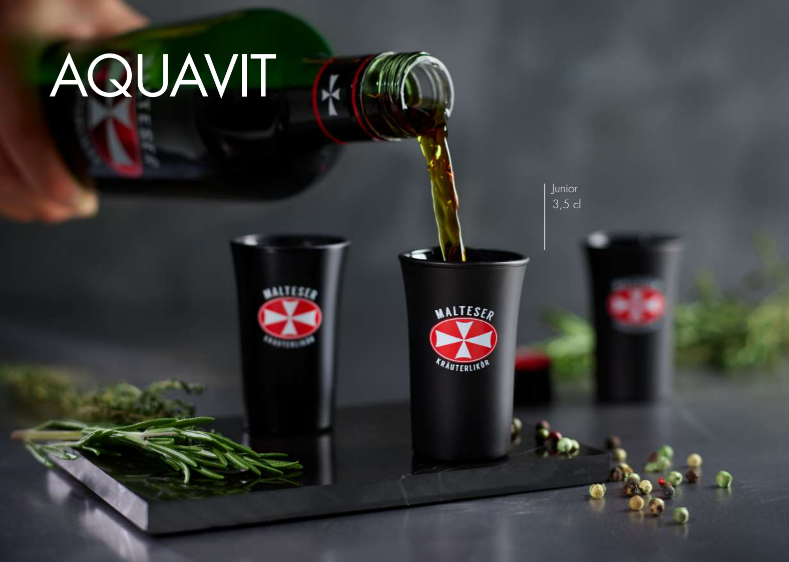
Junior 3,5 cl