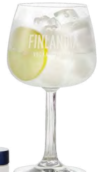
Finlandia Exklusiv 45 cl