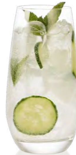
GG Longdrink 45 cl

Vodka is light and fresh and can be combined in an incredibly many ways. So it's no wonder that it is often used as a base for micro cocktails or shot cocktails. In response to this, RITZENHOFF offers a range of glass solutions: high-quality goblets, chic long drink glasses or trendy shot glasses. Combine them as you wish!