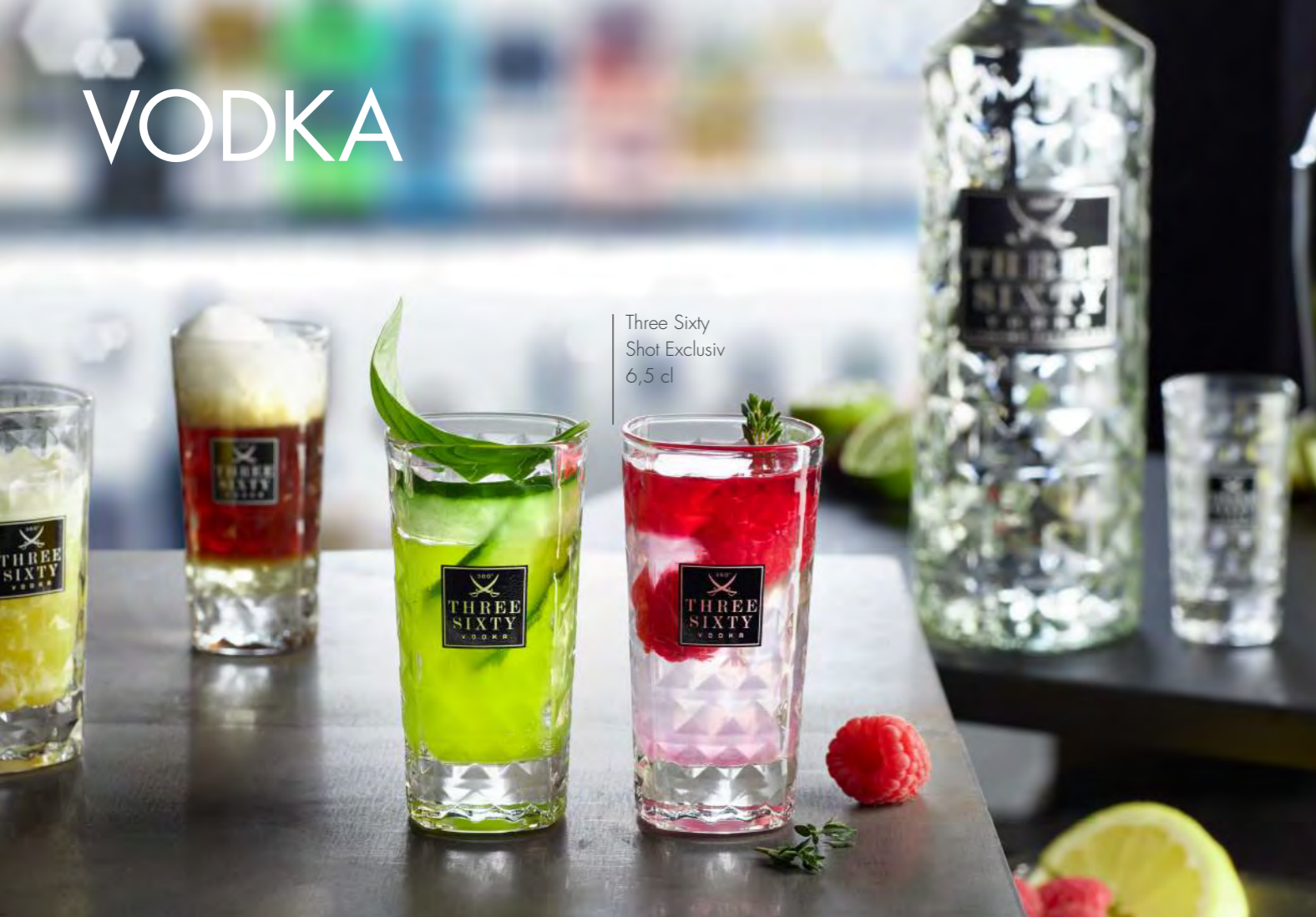
Three Sixty Shot Exklusiv 6,5 cl

Um Kollektionen zu kreieren, wurden Bartender und Blogger für ein Three Sixty Vodka Cocktail Creation Lab zusammengetrommelt. Nach vorgegebenen Mottos entstanden die verschiedensten Kreationen auf der Basis des Three Sixty Vodkas. Das Glas: RITZENHOFF.