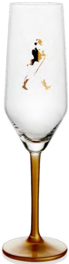
Vivien Champagne 27 cl