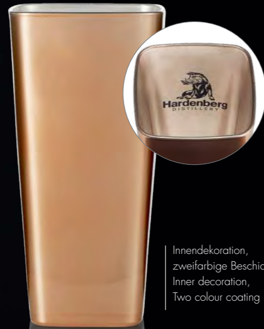
Innendekoration, zweifarbige Beschichtung/ Inner decoration, Two colour coating