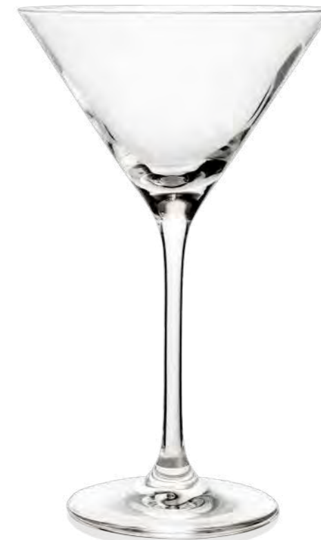
Next Cocktail 23 cl