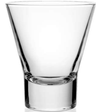
Y Tumbler 15 cl | 25,5 cl 35,5 cl