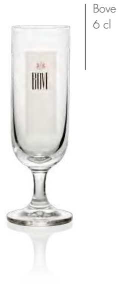
Bove 6 cl