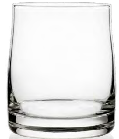
Stark 35 cl

Whisky oder Whiskey, schottischer Scotch, irischer Single Malt oder amerikanischer Bourbon – perfekt präsentiert in Markengläsern von RITZENHOFF. Die Designs reichen von wertigen Tasting-Gläsern, über klassische Tumbler bis zu funktionalen Longdrink-Glasformen für Whisky-Mixes – stapelfähig natürlich!