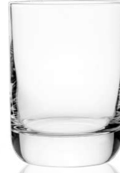
Envy 20 cl | 26 cl 32 cl