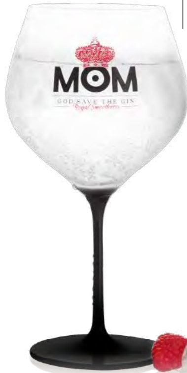
Aspergo Gin 70 cl