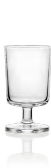
Mountain Spirit 9 cl