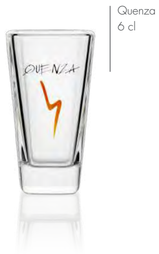
Quenza 6 cl

For shots and shooters, RITZENHOFF offers a wide range of different goblet and stamper shapes, which will also convince people of your brand in just one sip.