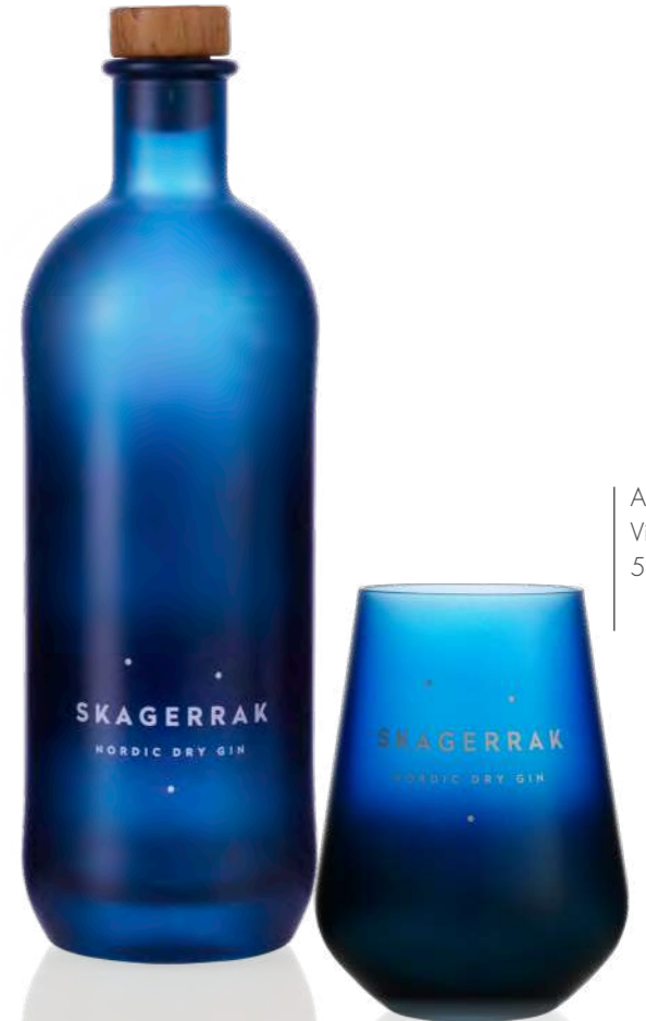
Aqua & Vino blue 54 cl