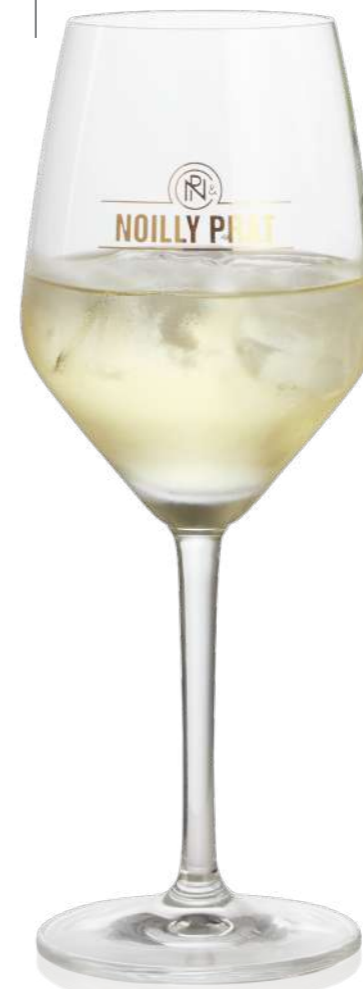
Vivien 36 cl

to the bars of the world in a RITZENHOFF glass: Noilly Prat.