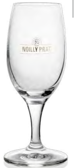
König 14 cl