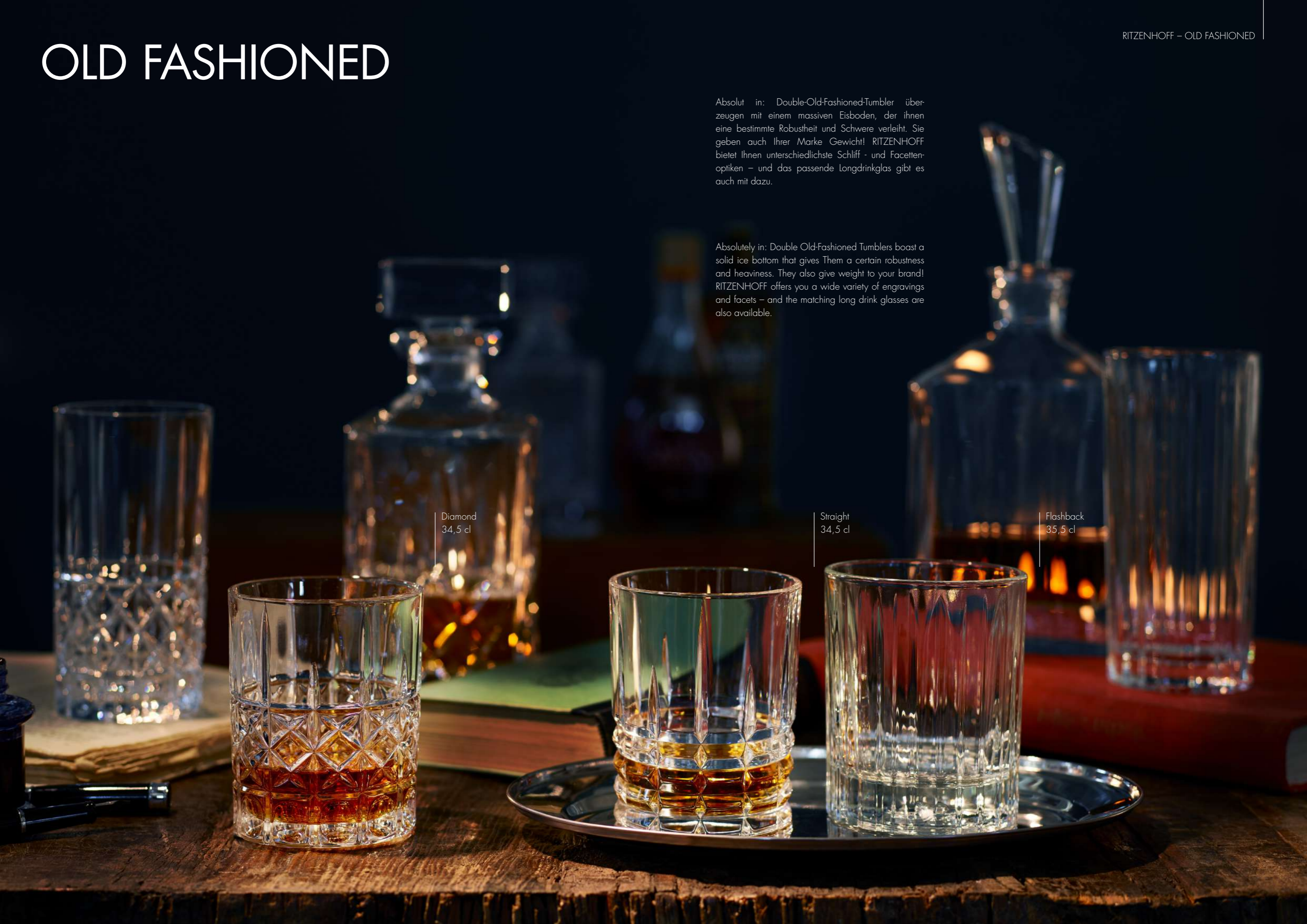
Flashback 35,5 cl