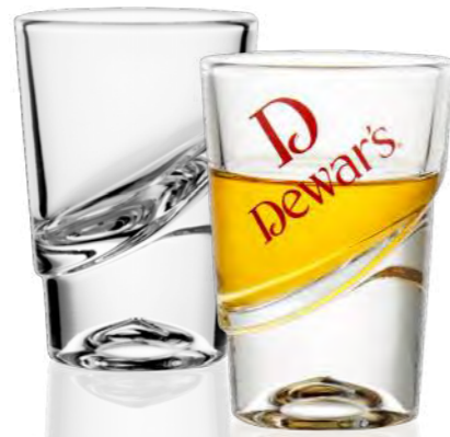
Durban 5,5 cl