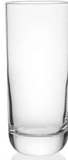
Envy 29 cl | 35 cl 41 cl