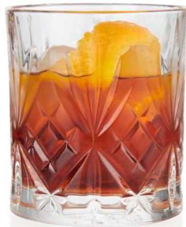
Melodia Tumbler 23 cl | 31 cl