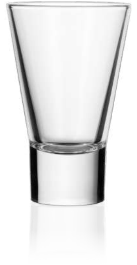
V-Line 14 cl