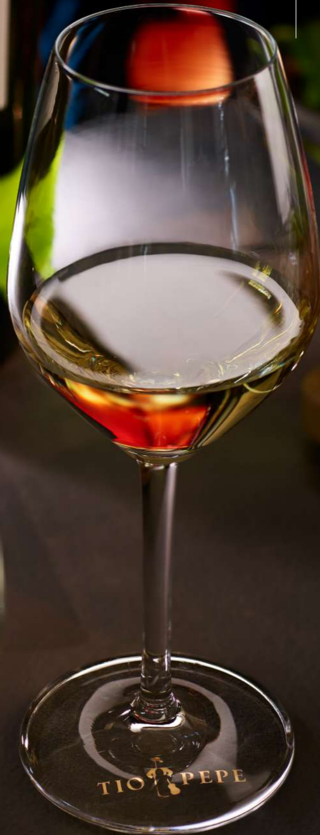
Vivien 35 cl