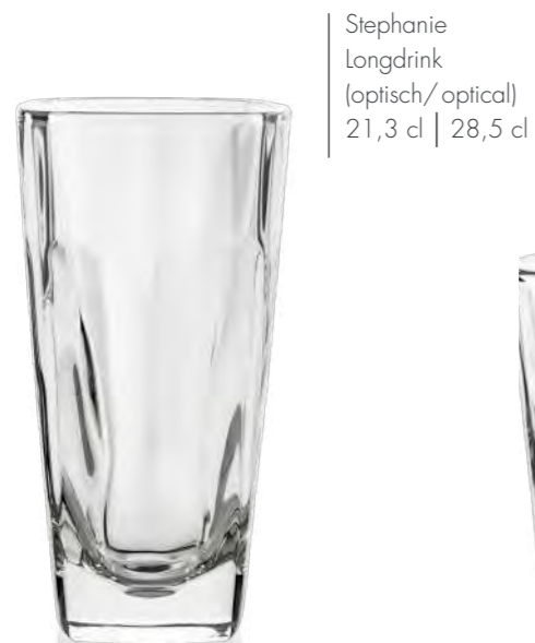
Stephanie Longdrink (optisch/optical) 21,3 cl | 28,5 cl

In order to create new collections, bartenders and bloggers were brought together for a Three Sixty vodka cocktail creation lab. A range of creations were compiled using with the title drink, Three Sixty vodka. The glass: RITZENHOFF.