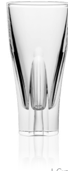
Iso 13 cl