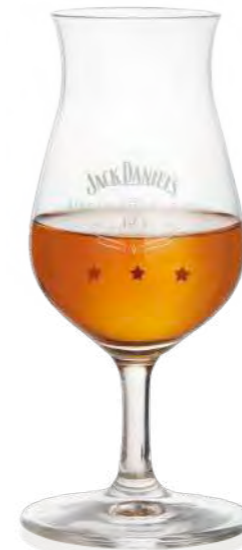
Connoisseur 15 cl