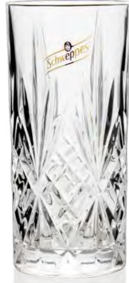
Melodia Longdrink 36 cl