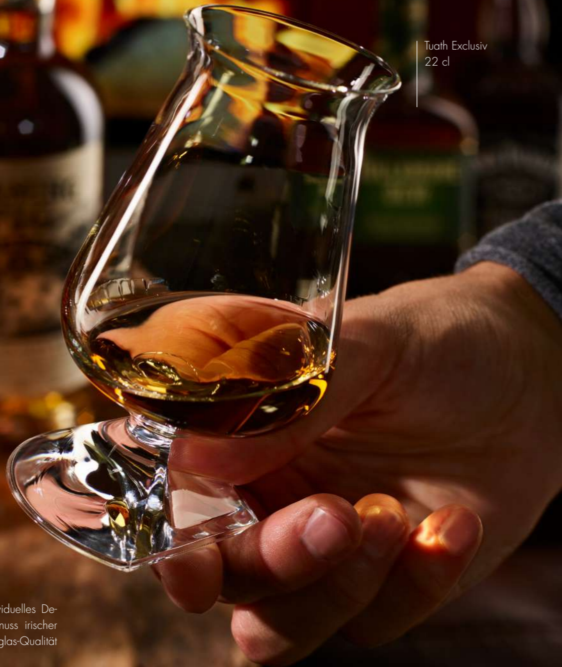
Tuath Exclusiv 22 cl

The Tuath. Ireland in a Glass. Individuelles Design, kreiert für den exklusiven Genuss irischer Whiskys. Gefertigt in bester Kristallglas-Qualität bei RITZENHOFF.