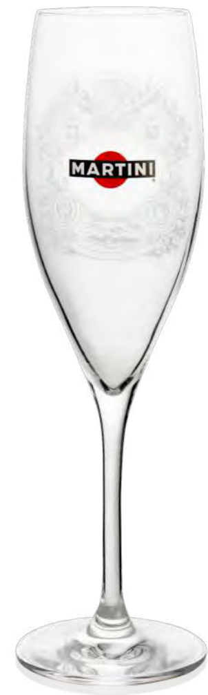
Jolie 27 cl