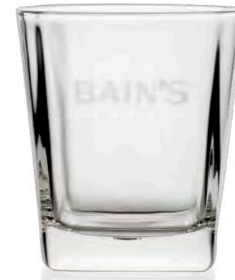
Stephanie 20 cl | 30 cl