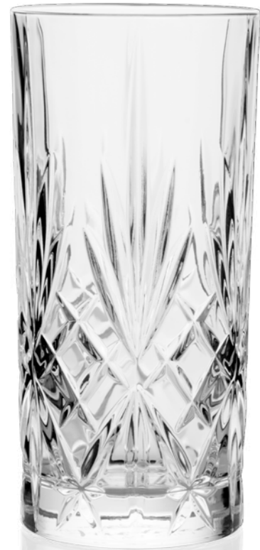
Melodia Longdrink 36 cl