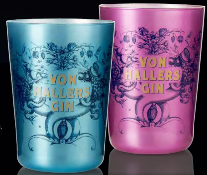
Zweifarbige Beschichtung, organischer Druck/ Two colour coating print organic