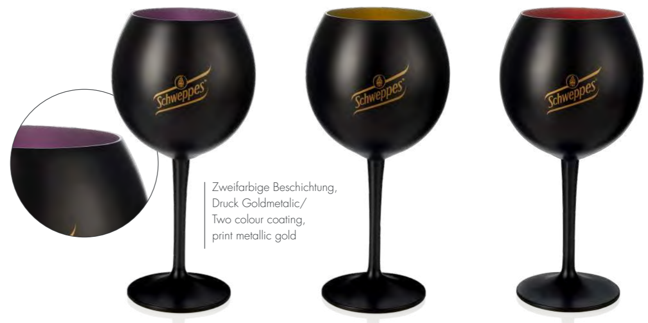
Zweifarbige Beschichtung, Druck Goldmetalic/ Two colour coating, print metallic gold