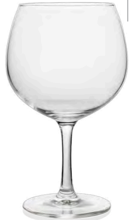
Gin Club 70 70 cl