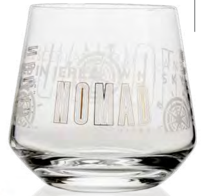
Carlos 42 cl