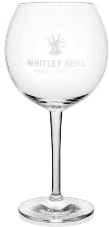
Gin Copa 70 cl