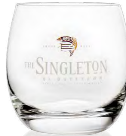
Aspergo 37 cl

The Tuath. Ireland in a glass. Individual design, created for the exclusive enjoyment of Irish whiskies. Produced in top crystal glass quality by RITZENHOFF.