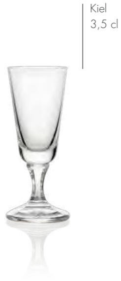
Kiel 3,5 cl