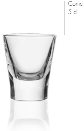
Conic 5 cl