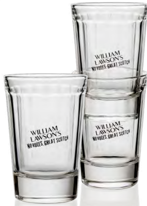
Lawson Exclusiv (stapelbar/ stackable) 25 cl