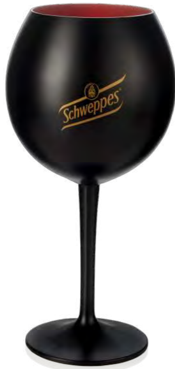
Schweppes 62 cl