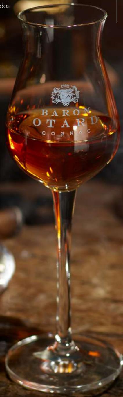
Otard 15 cl

Die Traditionsspirituose Cognac erfindet sich gerade neu: ob pur, im Longdrink oder in angesagten Cocktails. Genauso neu: die unterschiedlichsten Glasformen aus denen Cognac heute getrunken wird. Die Auswahl reicht vom klassischen Kelch oder Schwenker bis hin zu trendigen Tumbler- und Tasting-Gläsern. Da sollte auch für Ihre Marke das Passende dabei sein!