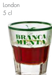
London 5 cl