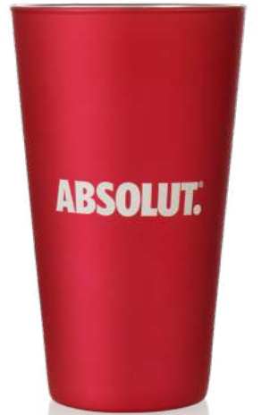
Conical 47 cl